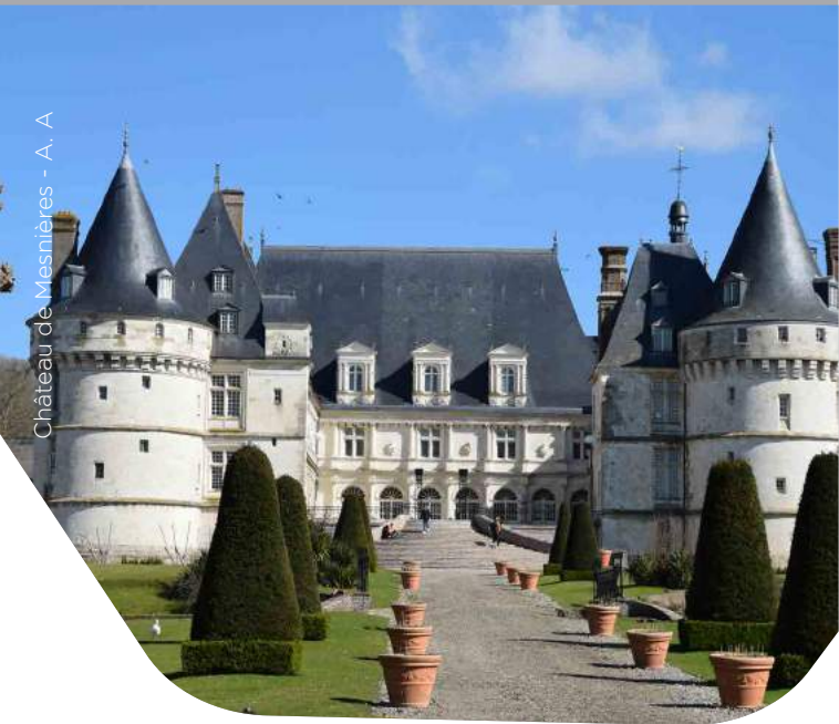
Château de Mesnières - A. A.