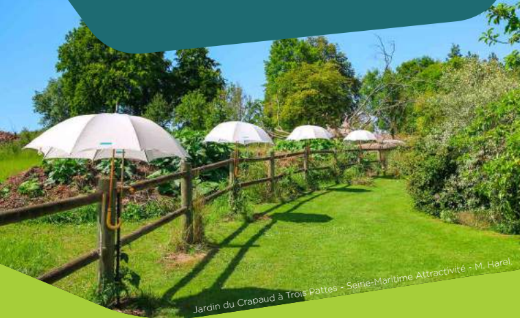
Jardin du Crapaud à Trois Pattes - Seine-Maritime Attractivité - M. Harel