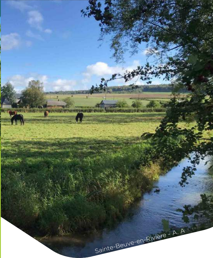
Sainte-Beuve-en-Rivière - A. A.