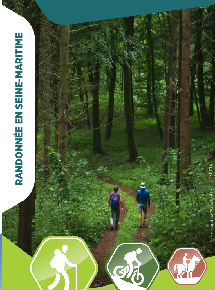
Seine-Maritime Attractivité - D. GENESTAL