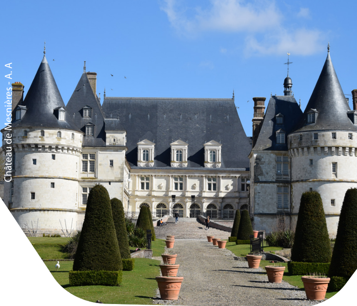
Château de Mesnières - A. A