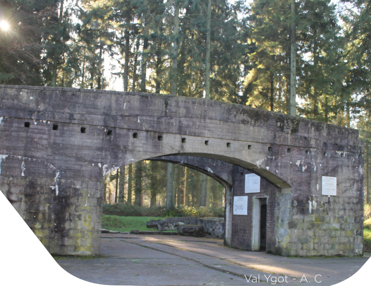
Val Ygot - A. C