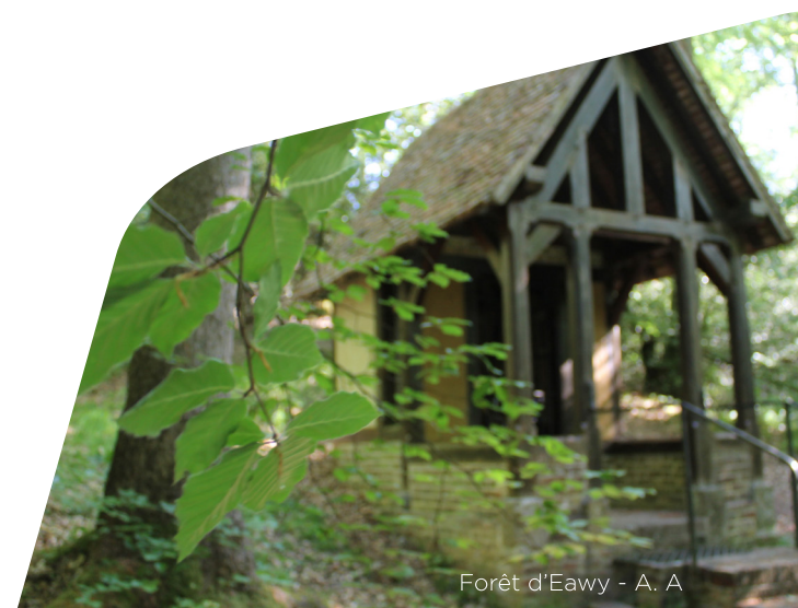
Forêt d'Eawy - A. A

Vous commencerez votre circuit par un point de vue admirable sur les vestiges de l'ancien château fort de Bellencombre. Avant de rejoindre le château de La Heuze, par un petit détour, vous pourrez apercevoir sur votre droite la chèvrerie du Val de Bures (vente de fromages). Vous reviendrez ensuite par les bords de la Varenne.