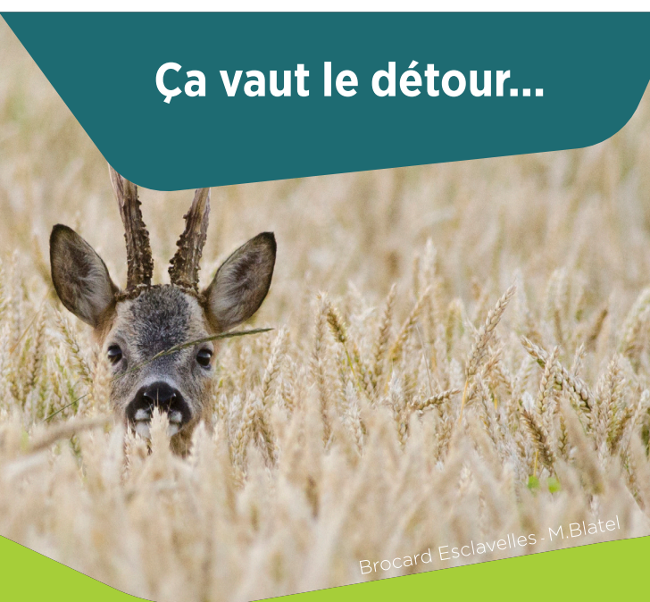
Brocard Esclavelles - M.Blatel