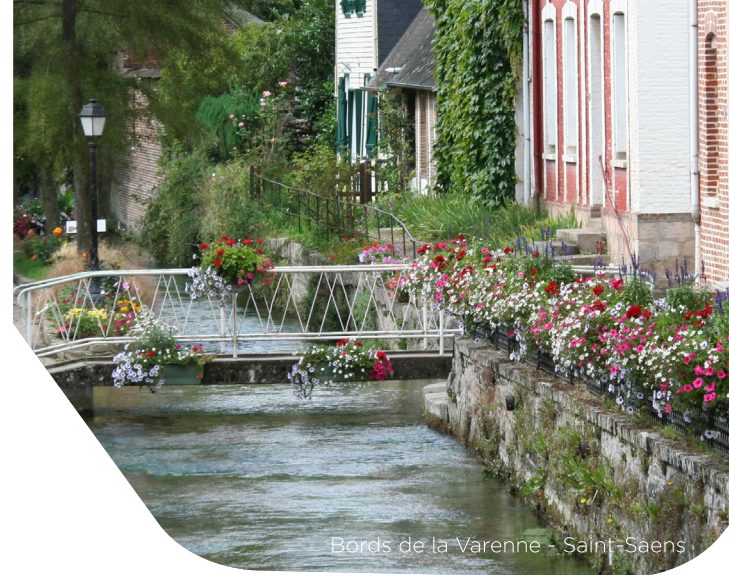
Bords de la Varenne - Saint-Saens

Toute l'année, vous pourrez apprécier le rythme des saisons en milieu forestier. Vous emprunterez l'Allée des Limousins et aurez une vue surprenante sur cette traversée rectiligne.